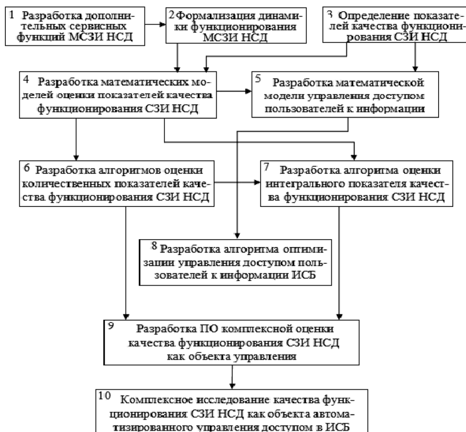
Рис. 2. Структурная схема разработки МО

В результате анализа задач и этапов управления контролем доступа пользователей в ИСБ, на основе комплексной оценки её качества функционирования, разработана структурная схема разработки МО автоматизированного контроля доступа пользователей к информации в ИСБ, представленная на рис. 2.